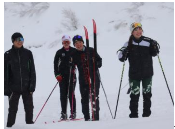
クロスカントリーで仲間を応援する姿