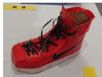
美術部部門 特選「孤影悄然」 2年 横井 歩々愛