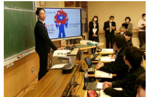
社会科:集団での授業風景

一つの目標に向かうときに、なりふり構わず走っていてもたどり着けないことがあるかもしれません。しかし、信頼できる仲間と目標に向かう戦略があるチームであれば、その達成は意外と早く、可能性は高まります。生徒たちが自分の強みや弱みを開示、その上で自分の力を発揮できるような関係性がもっと強くなるよう、これからも指導していきたいと思っています。