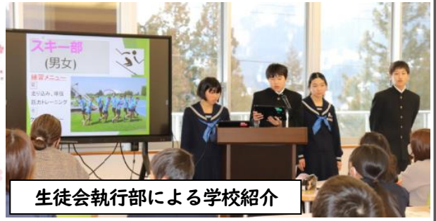
生徒会執行部による学校紹介