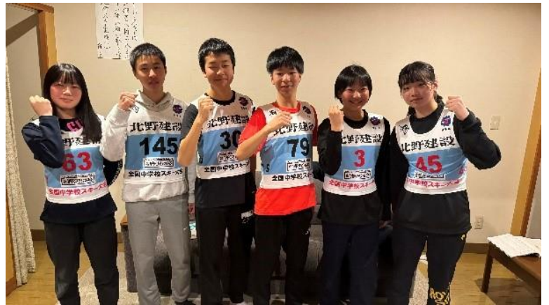
<全国中学校スキー大会前日>

同じように他の部でも、多くの方々に支えられています。日々の教育活動でも地域の方に話をいただいたり、生徒が考えた案を実現してくださったりと、子供たちの成長を見守ってくださいました。これまでの支えによって、子供たちは大きくたくましく成長してきました。3年生は、いよいよ県立入試が近づいてきました。そして、まもなく卒業です。自信をもって入試に臨み、感謝の気持ちをもって巣立ってくれることを願っています。