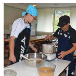
桂湖ビクターセンター