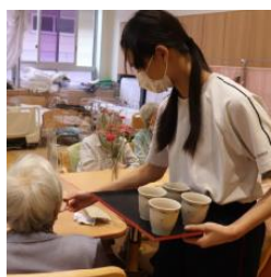
上平デパートセンター