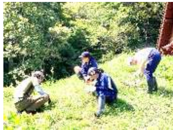
上平観光開発株式会社