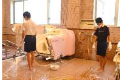
上平デイサービスセンター