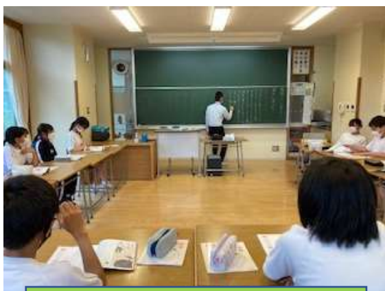
1年：道徳「選手に選ばれて」