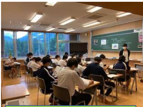
2年：道徳「左手でつかんだ音楽」