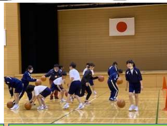
1年：保健体育「バスケットボール」