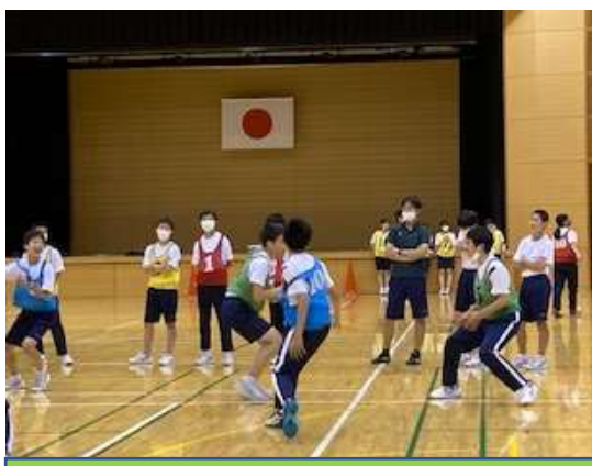
2、3年：保健体育「バスケットボール」